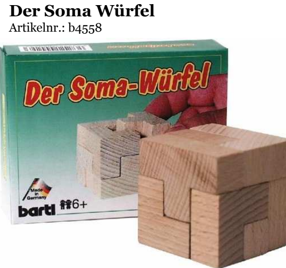
Der Soma Würfel Artikelnr.: b4558