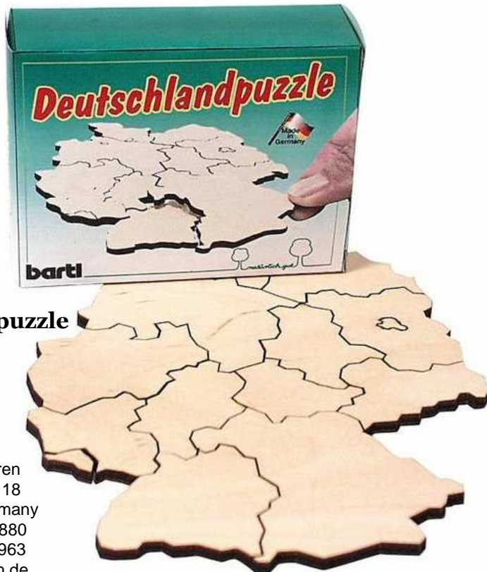
Deutschlandpuzzle Artikelnr.: 2359

Herausgeber: Inka Dreisbach Spielwaren Theodor Heuss Strasse 18 57271 Hilchenbach Germany Telefon: +49 02733 128880 Telefax: +49 02733 813963 E-Mail: huhu@yoomcom.de Internet: www.yoomcom.de Umsatzsteuer-Identifikationsnummer: DE 235024035