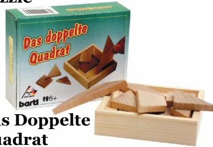
Das Doppelte Quadrat Artikelnr.: b6542