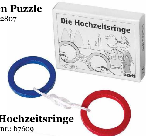
Die Hochzeitsringe Artikelnr.: b7609