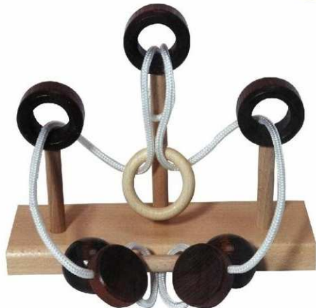
Ringpuzzle G Artikelnr.: b2492