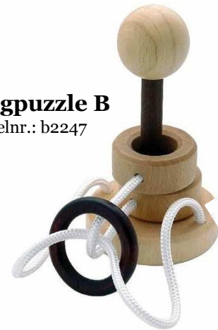
Ringpuzzle B Artikelnr.: b2247