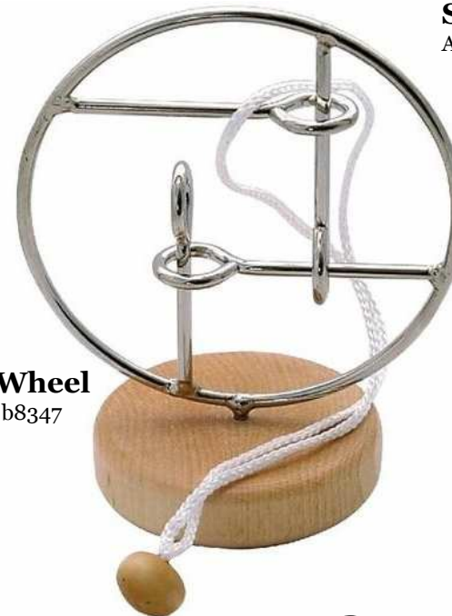
Ferris Wheel Artikelnr.: b8347