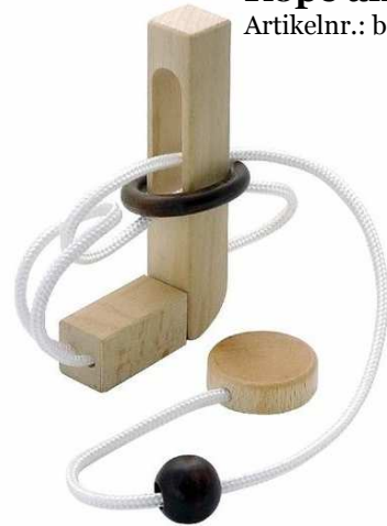
Rope and Rope Artikelnr.: b6876