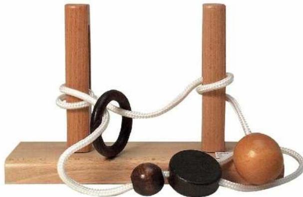
Ringpuzzle F Artikelnr.: b2491