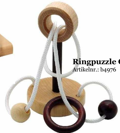
Ringpuzzle O Artikelnr.: b4976