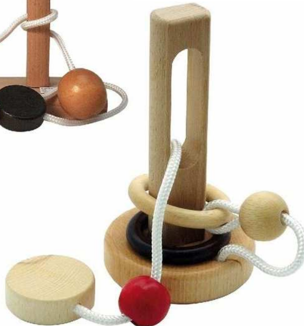
Ringpuzzle Narrow Escape Artikelnr.: b8346