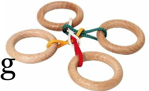
Seilpuzzle 4 Ringe Artikelnr.: b4350