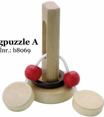
Ringpuzzle A Artikelnr.: b8069