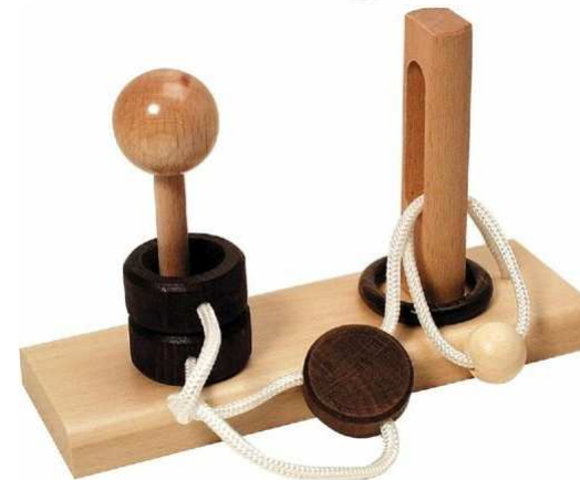
Ringpuzzle E Artikelnr.: b4974