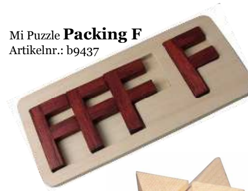
Mi Puzzle Packing F Artikelnr.: b9437