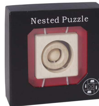
Mi Puzzle Nested Quadrat Artikelnr.: b9430