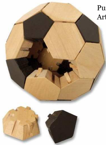
Puzzle Fußball Artikelnr.: b7986