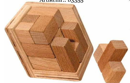
Schräglicher Würfel Artikelnr.: b3355