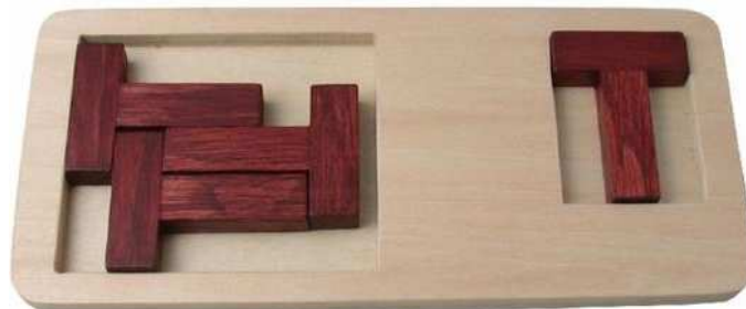
Mi Packing T Puzzle Artikelnr.: b9439