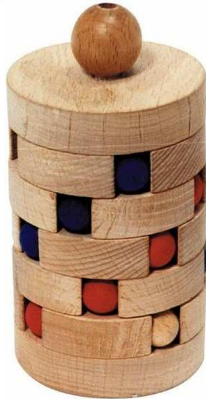
Kugelturm Artikelnr.: b1545