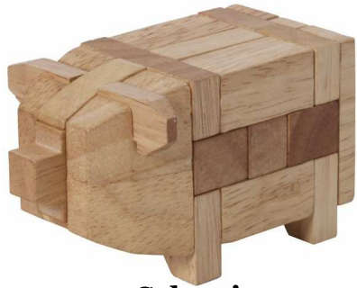
Mi Tierpuzzle Schwein Artikelnr.: b9421